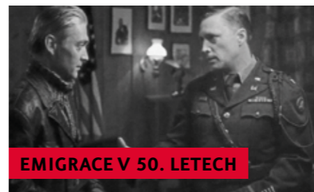
EMIGRACE V 50. LETECH

Po skončení 2. světové války byli ze severočeského Žatce vyhnáni čeští Němci včetně starousedlíků a členů smíšených rodin. Část z nich se ale nedostala dále než do sousedních Postoloprty, kde bylo násilně zabito 763 civilních osob.