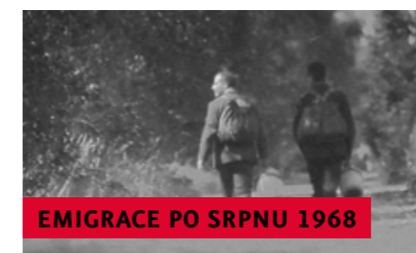
EMIGRACE PO SRPNU 1968

V dubnu 1950 uskutečnila StB první etapu Akce K, při které bylo obsazeno na 75 klášterů. Likvidace katolické církve pokračovala brzy další etapou, při které byly ničeny řeholní domy a internováno do jiných klášterů nebo vězení více než 2 300 řeholníků.