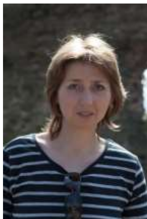
Fotografie č. 7