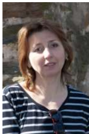
Fotografie č. 3