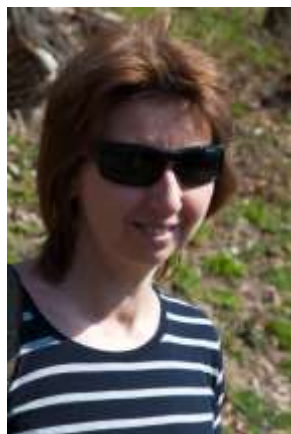
Fotografie č. 2