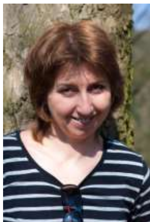
Fotografie č. 1