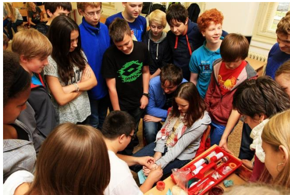
Český červený kříž