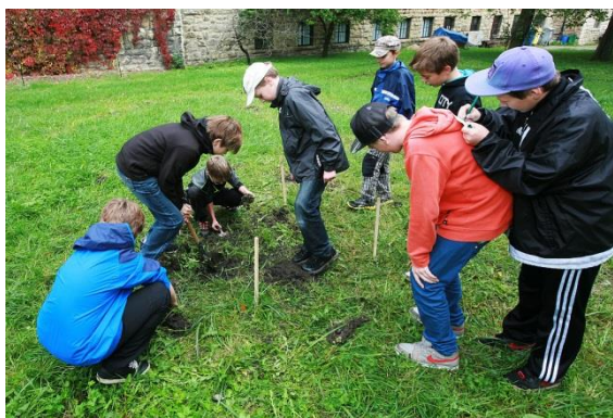
Honba za pokladem