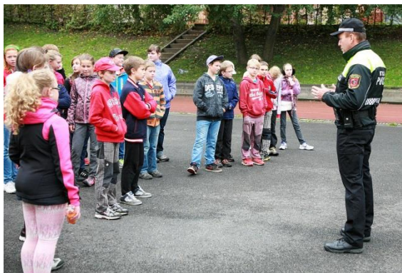
Městská policie ČT