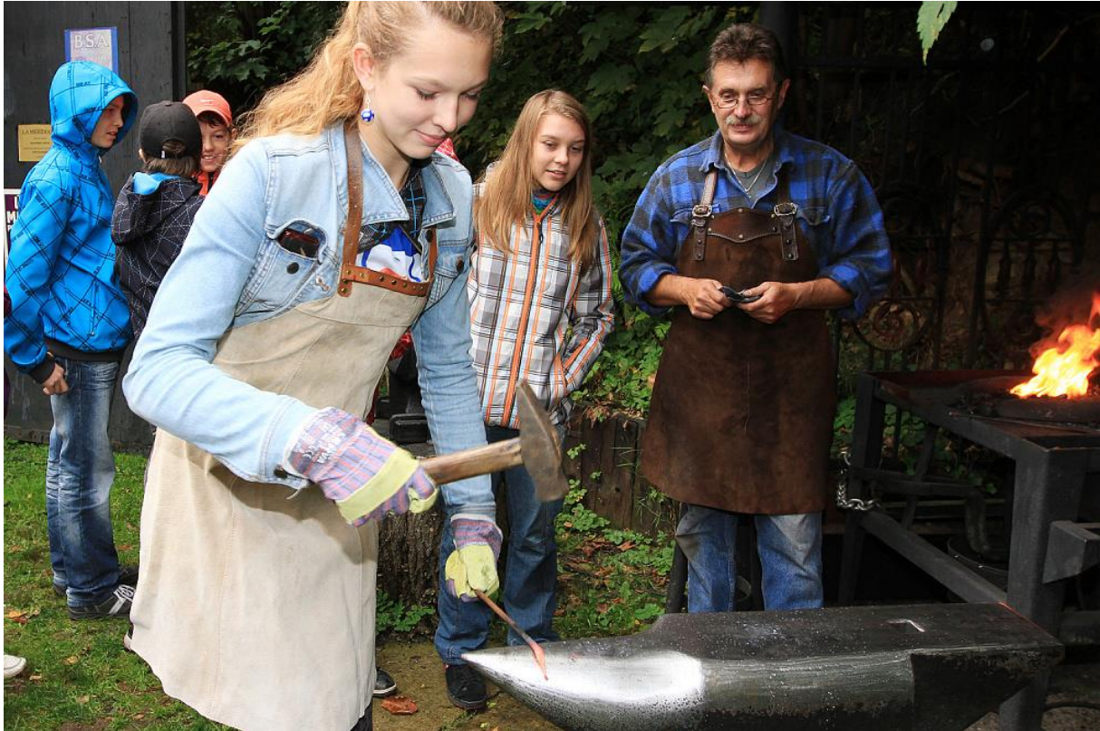
Kovárna F. Bečky