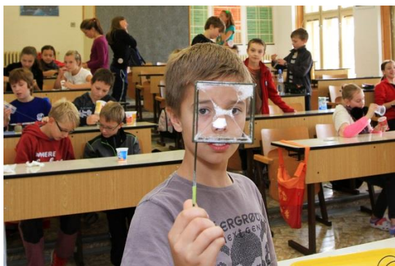
Fyzika – pokusy