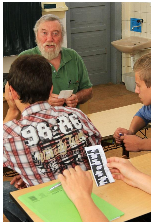
Konverzace s rodilým mluvčím v angličtině