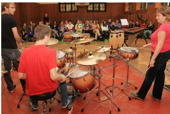
Hudební program – bubeníci