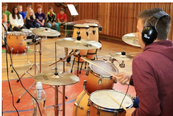
Hudební program – bubeníci