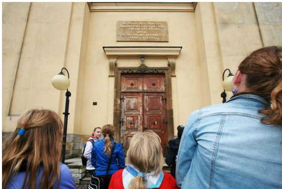
Zastavení u kostela sv. Jakuba