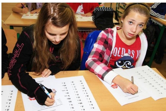
Jazykový workshop z ruštiny