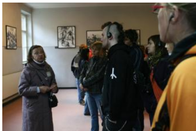
Výklad paní průvodkyně