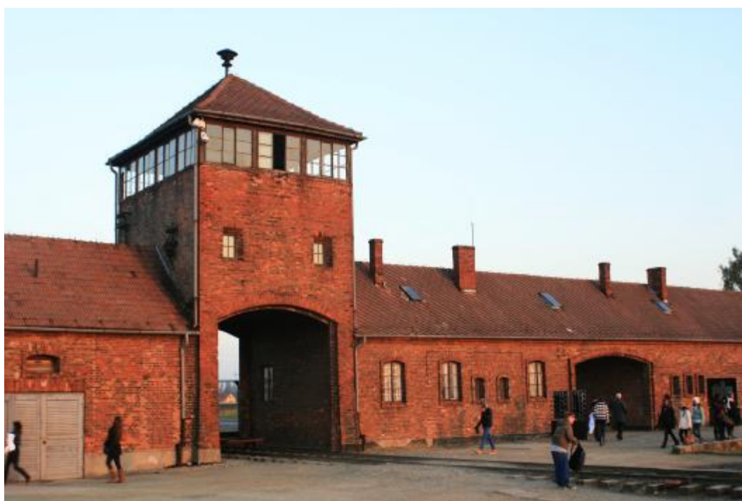
Příjezd do druhého koncentračního tábora v Březince