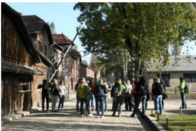
Vstup do koncentračního tábora v Osvětimi