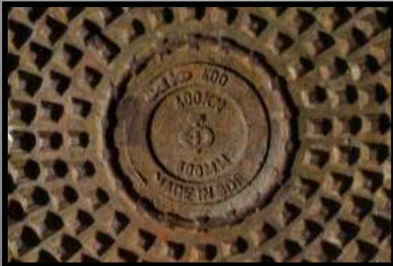
Obr. č. 21: Struktura