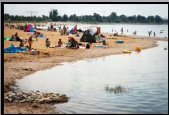
Obr. č. 12: Křivka S