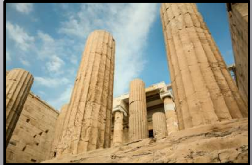
Obr. č. 8: Antika