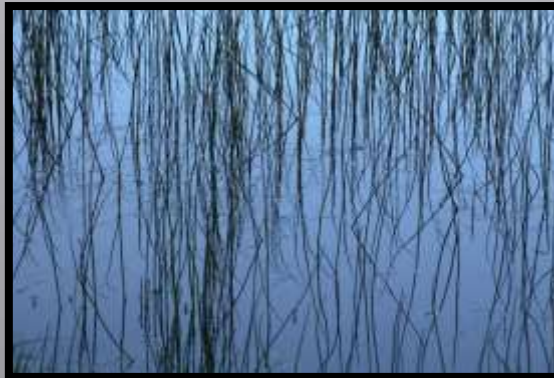
Obr. č. 22: Struktura