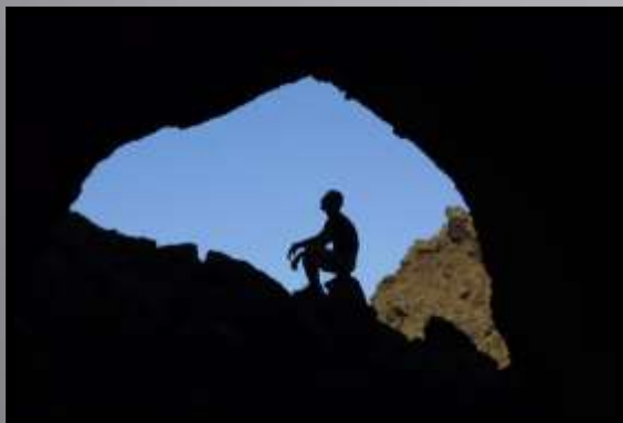
Obr. č. 36: Rám