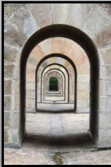
Obr. č. 28: Most