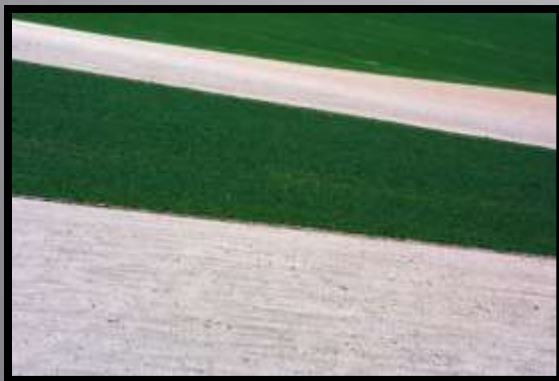
Obr. č. 41: Pole