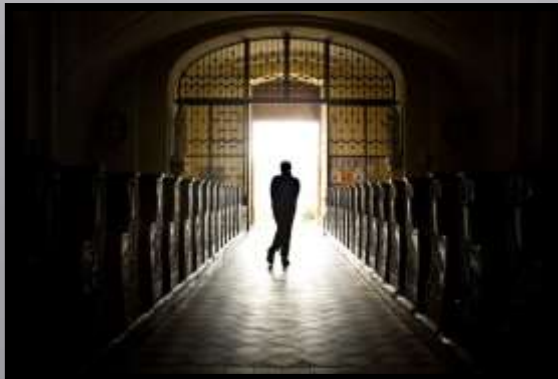
Obr. č. 31: V kostele