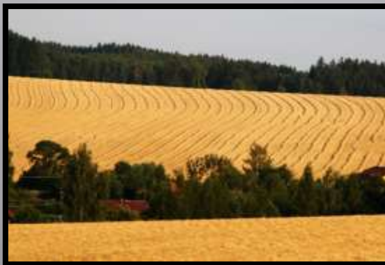
Obr. č. 5: Pole