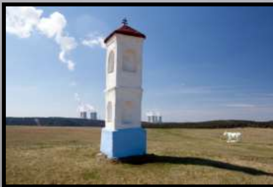
Obr. č. 34: Kontrast barev i tvarů