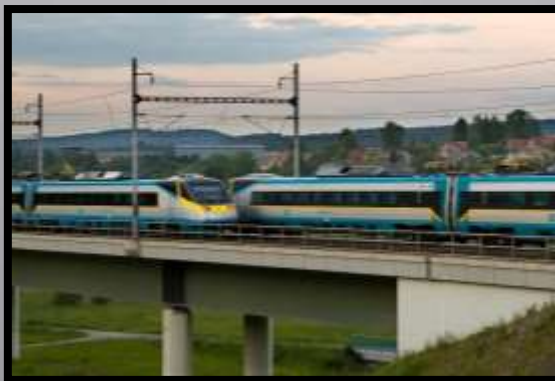
Obr. č 2: Pendolína