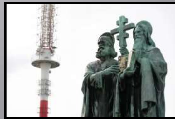
Obr. č. 35: Šíření informací