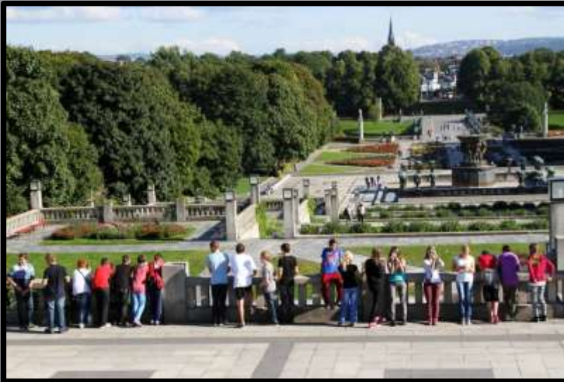
Obr. č. 7: Oslo