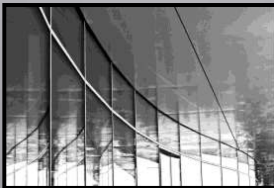
Obr. č. 13: Křivka S