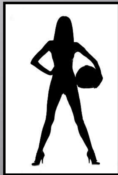
Obr. č. 17: Dívka