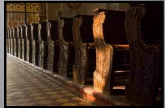
Obr. č. 29: V kostele