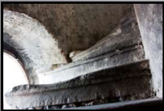
Obr. č. 33: Schody