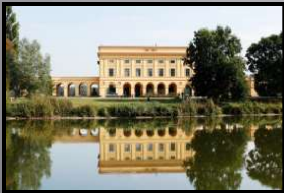
Obr. č. 30: Zrcadlení