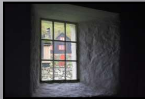
Obr. č. 38: Okno