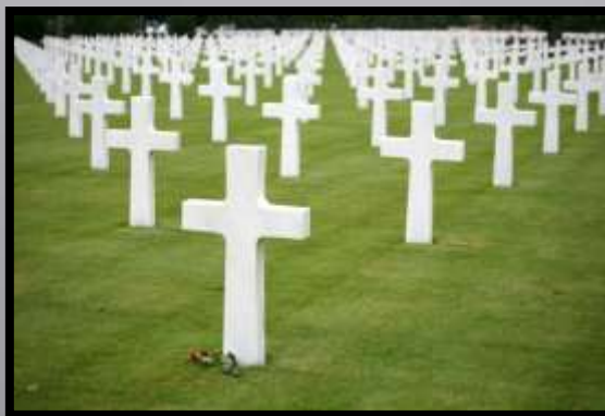
Obr. č. 10: Kříže