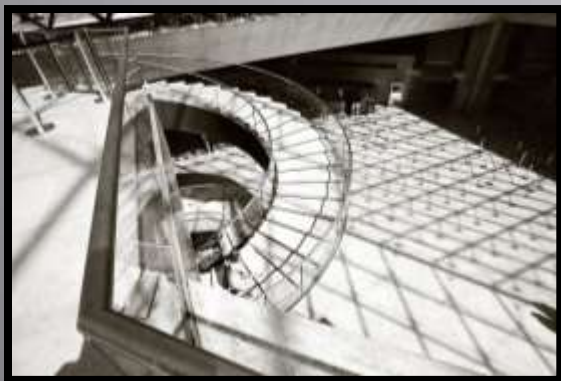
Obr. č. 15: Schodiště