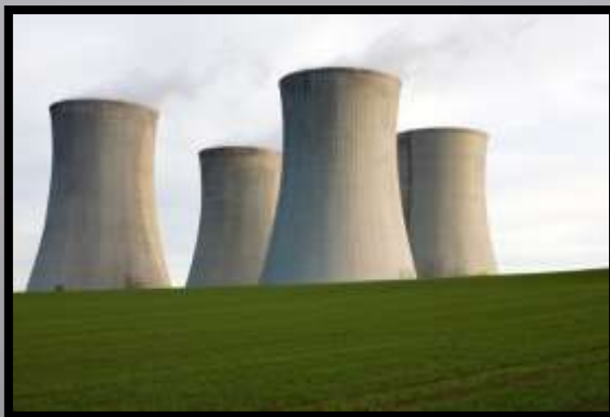
Obr. č. 16: Elektrárna