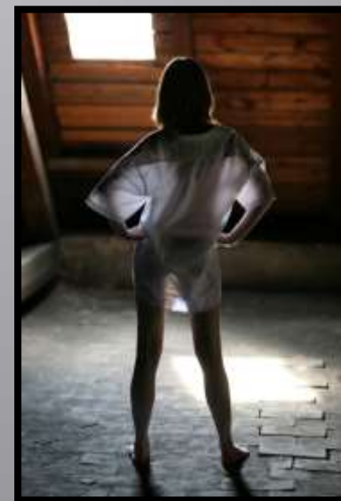
Obr. č. 20: Káťa