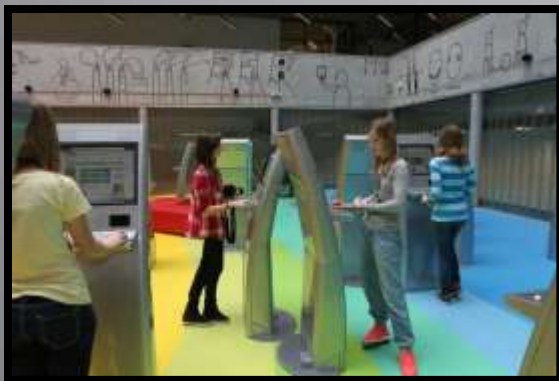
Obr. č. 4: V knihovně