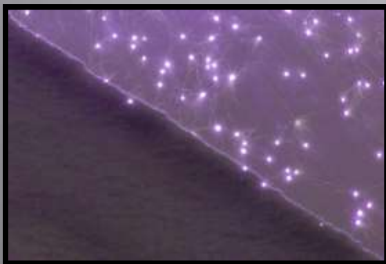
Obr. č. 24: Uhlopříčka