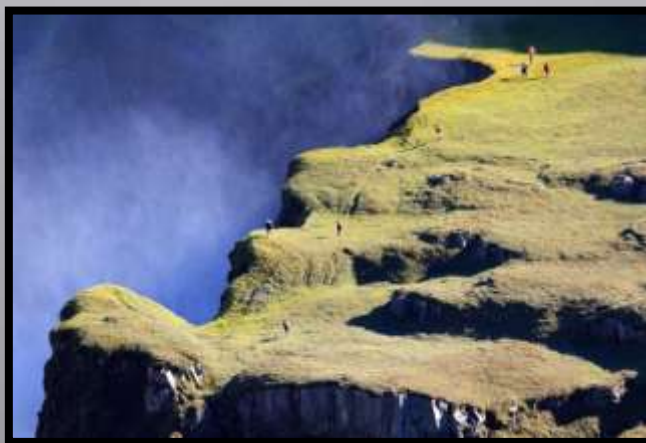
Obr. č. 40: Island