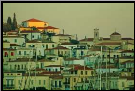
Obr. č 1: Světlo

Linie a křivky, Tvary a objekty, Světla a stíny (jas), Barva, Textura