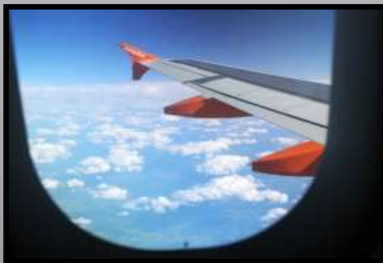
Obr. č. 37: Rám