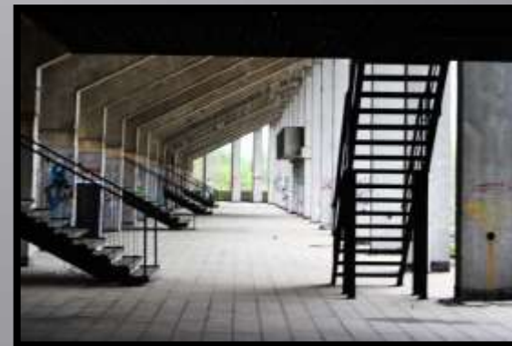
Obr. č. 6: Strahov