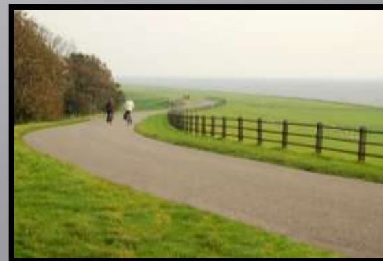
Obr. č. 14: Křivka S