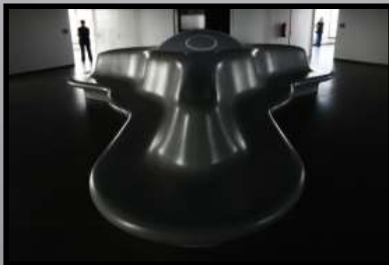
Obr. č. 19: Žižkov