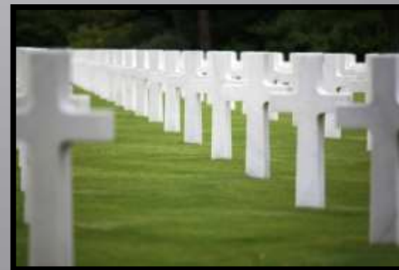
Obr. č. 26: Kříže