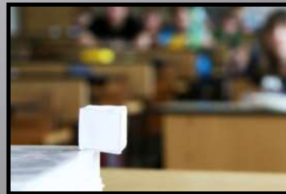
Obr. č. 43: Pokusy