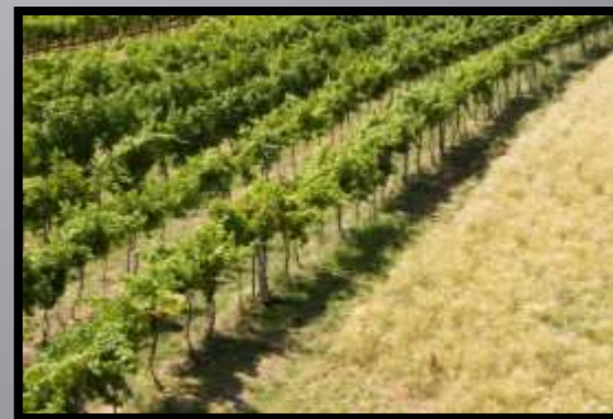
Obr. č. 11: Vinice