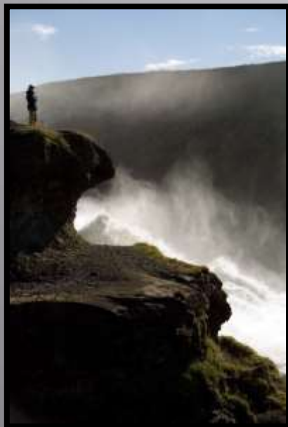
Obr. č. 39: Vodopád

Umístíme-li jedinečný tvar lidské postavy do rozlehlé scenérie přírodní či městské stane se základem pro odhadování rozměrů a velikostí .