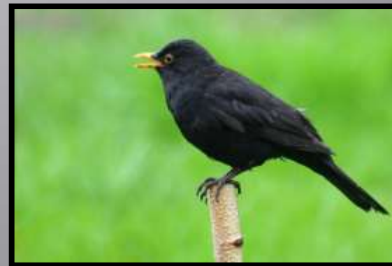
Obr. č 3: Kos