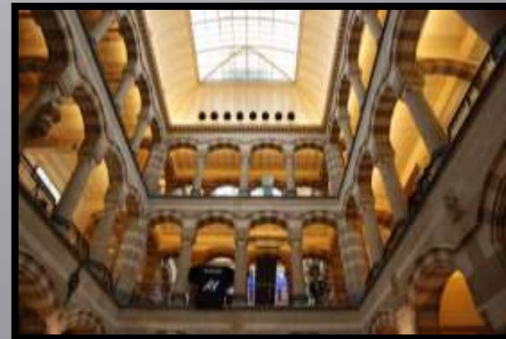
Obr. č. 32: Obchodní dům