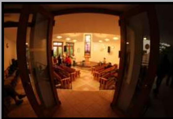
Obr. č. 25: Do kostela