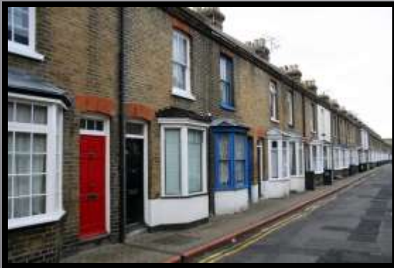
Obr. č. 27: Anglie