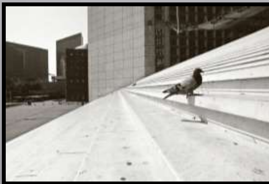
Obr. č. 42: Paříž