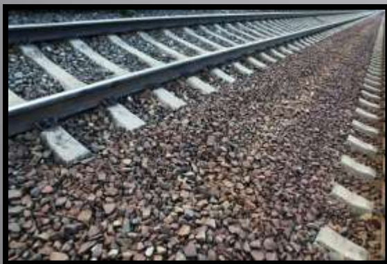
Obr. č. 9: Koleje